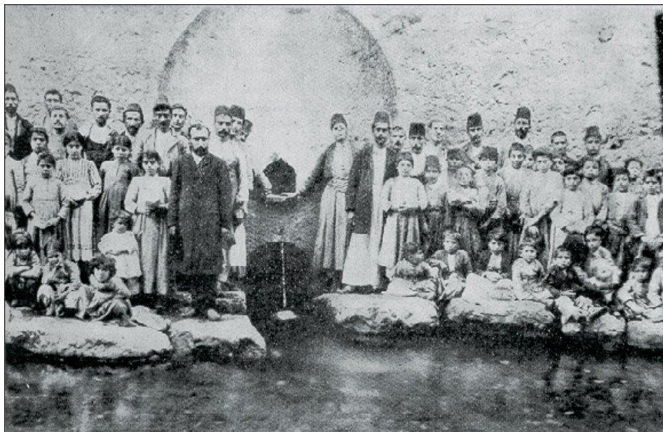
Իջմէի Ս. Նիկողոս եկեղեցոյ խորանին տակէն բխող աղբիւրը (Մանուկ Գ. Ճիզմէնեան, «Խարբերդ եւ իր զաւակները», Ֆրեզնօ, Գալիֆորնիա, 1955, էջ 83)