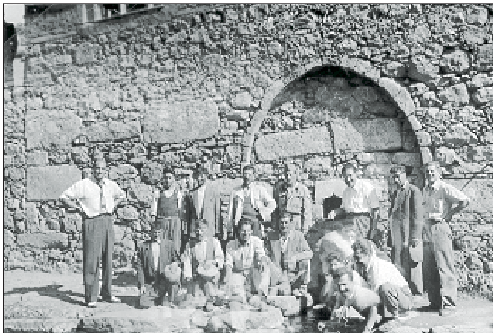
1953 Խորանին տակէն բխող աղբիւրը