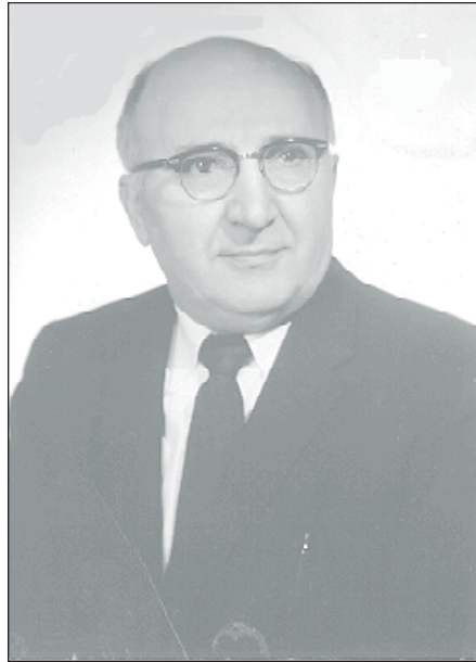
Հեղինակը՝ 1960ական թուականներուն